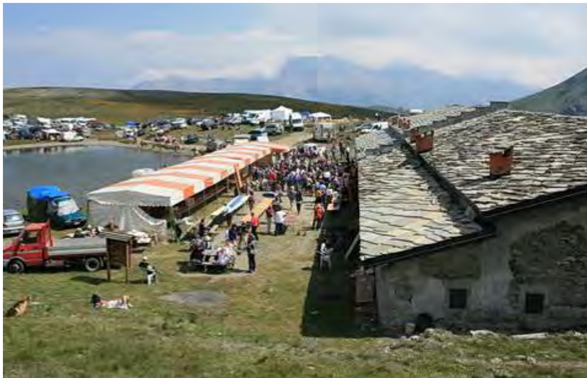
momenti della manifestazione pomeridiana