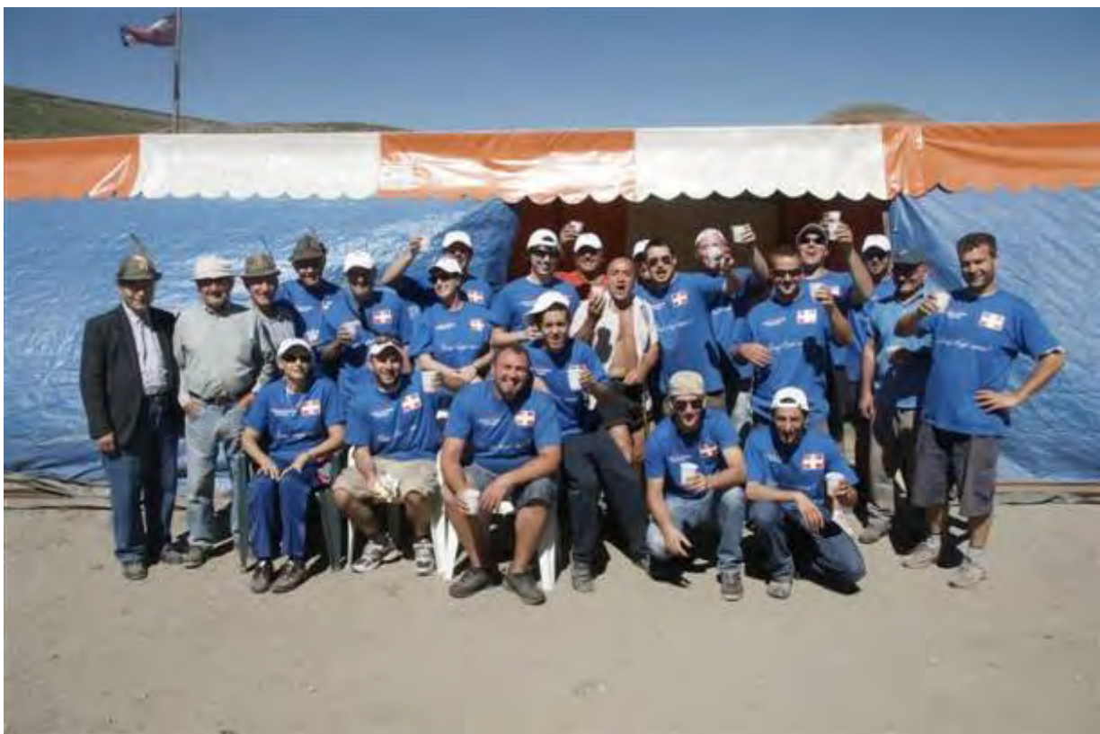
Lo Staff dell'Associazione